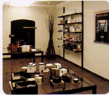
「男のサロン」をイメージした、シンプルで居心地の良い空間だ。

右：血止め水晶 9.9ユーロ 左：家族経営の小工場で作られる、クラ一社の石けん。3ユーロ