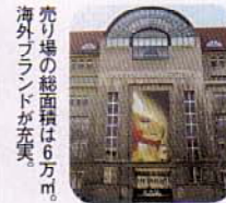
売り場の総面積は6万㎡。海外ブランドが充実。